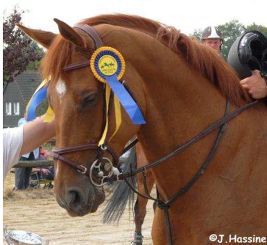
Olem Choisi, gagnant du GP 1m35 Longueville-sur-Scie 2009

Orchestré d'une main de maître par l'équipe du Centre équestre de la Scie, le concours hippique de Longueville-sur-Scie a attiré près de 400 cavaliers sur 2 jours les 8 et 9 août 2009.