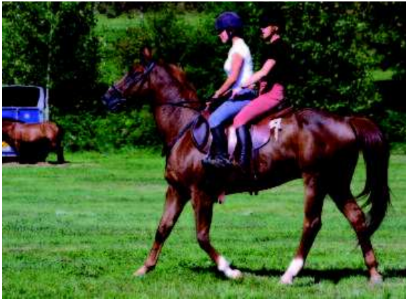
Une selle double mise au point dans l'Eure.

de l'éducation à l'insertion ou la réinsertion, en passant par les actions en direction de personnes handicapées, les services municipaux, la surveillance « écotoyenne », la diversification agricole, l'entretien écologique du territoire etc.